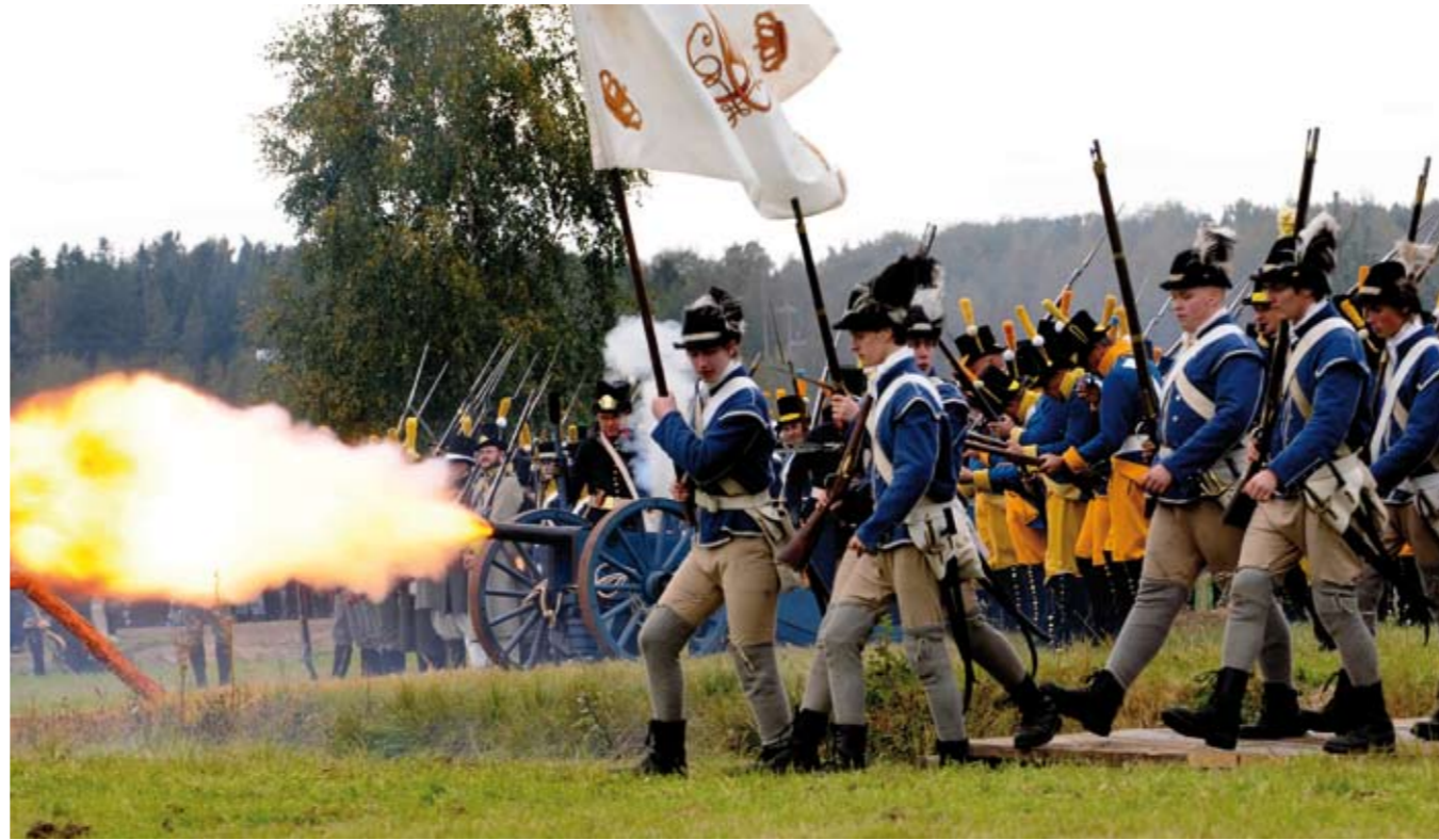
Slaget vid Oravais. Hösten 2008 samlades tusentals åskådare vid Oravais slagfält för att följa återskapandet av slaget 1808.

Radisson SAS, Hovrättsplanaden 18 tel: + 358 20 123 4720 SOKOS Hotel Vaakuna, Revell Center 101 tel: + 358 20 123 4671