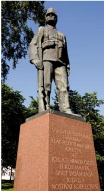
Jägerstatyn som står vid kanten av Hovrättsparken är skapad av Lauri Leppänen (1895–1977).